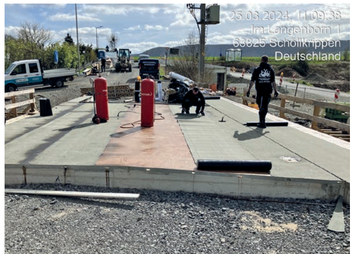
Abb.: Abdichtungsarbeiten am Brücken Überbau

Schalungs- und Bewehrungsarbeiten an den Brückenkappen