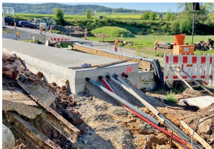
Abb.: Kabelverlegung durch die dafür vorgesehenen Leerrohre in den Brückenkappen

Aktuelle Bauarbeiten/Mitteilungen: Ausbau der Versorgerinfrastruktur für Langenborn