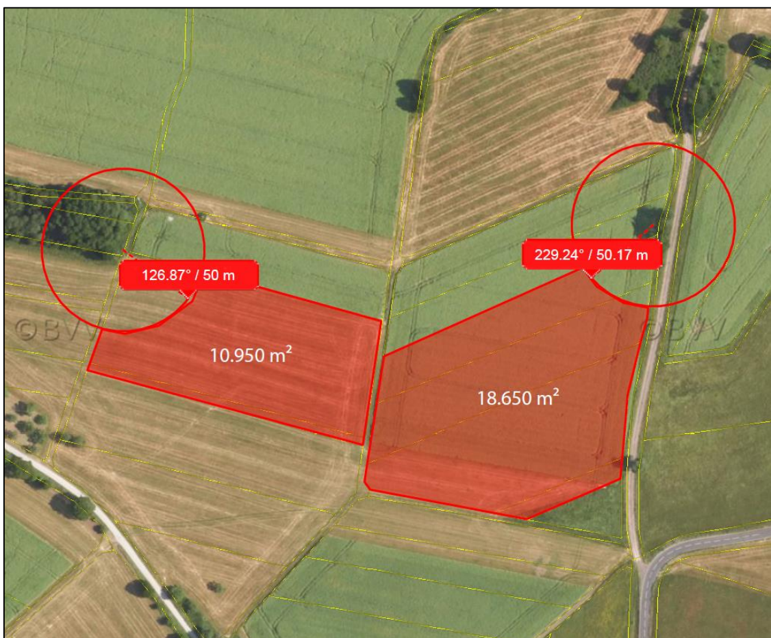
Teilplan B: Ausgleichsflächen für Feldlerche

Die roten Flächeneinfärbungen im nachfolgenden Luftbild zeigen die Ausgleichsflächen (anrechenbare Maßnahmenflächen für die Feldlerche).