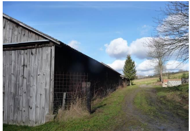
Scheunen am westlichen Rand des Geltungsbereiches