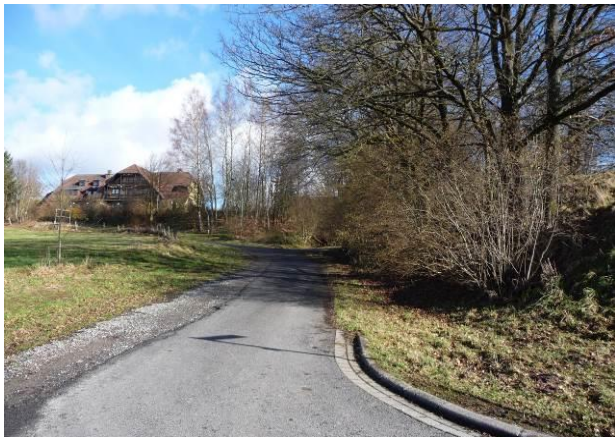
Feldgehölz (Biotop-Nr. 5822-0003-006)