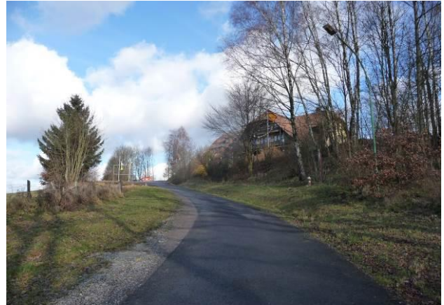
Blick auf das Seminargebäude und Gehölzflächen