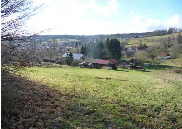
Intensiv genutzte Wiese (Blick von Nordosten)